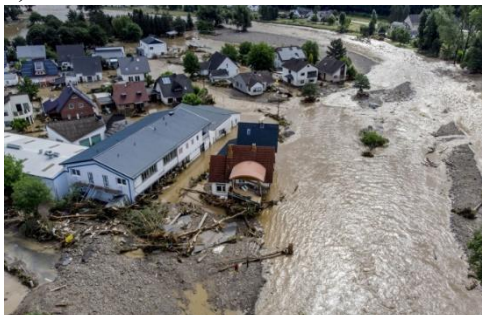
h) Lũ lụt