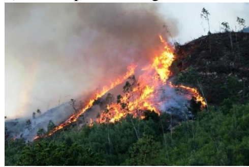
d) Cháy rừng