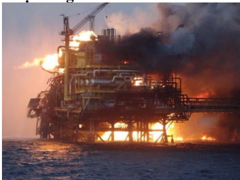
a) Cháy giàn khoan dầu trên biển