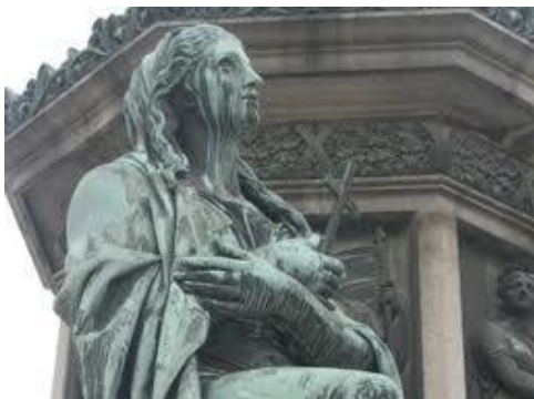
e) Mưa acid