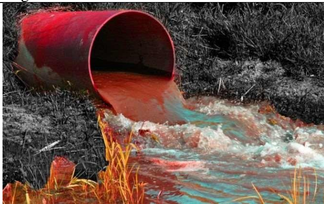
Ảnh: Nước thải do ngành công nghiệp dệt may thải ra môi trường

- Cho học sinh quan sát một số hình ảnh về chất thải do một số nhà máy thải ra hoặc một số bãi rác tập trung.