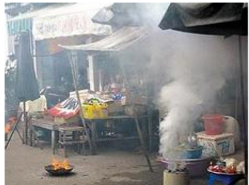
b) Khói bếp than tổ ong