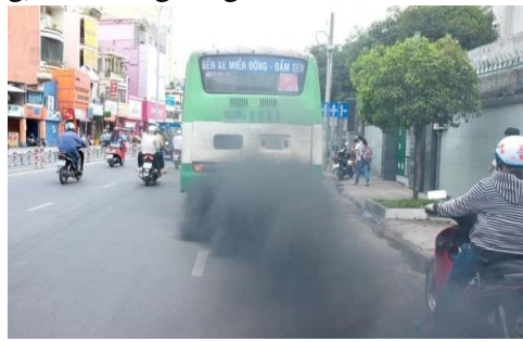
i) Khí thải từ phương tiện giao thông

- Học sinh chọn một hiện tượng theo các bức ảnh để trả lời các câu hỏi.