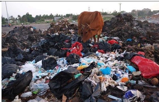
Ảnh: Chất thải công nghiệp, sinh hoạt thải ra gây hại đến môi trường